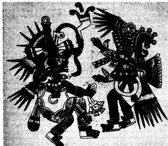
Obr. 1 Quetzalkoatl a Tezkatlipok

Všichni, kdo měli to štěstí a dostalo se jim takového hlubinného vhledu do kosmické tvůrčí laboratoře, by jistě souhlasili s tvrzením, že stupeň skutečnosti, který zažili, nelze výstižně vyjádřit slovy. Jako by mohutný impuls nepředstavitelných rozměrů zodpovědný za stvoření světů jevů obsahoval nejen všechny zmíněné prvky, byť se jeví našemu běžnému cítění a našemu prostému rozumu na první pohled sebevíc protichůdné a paradoxní, ale i řadu dalších prvků. Je zřejmé, že navzdory všem našim snahám o pochopení a popis stvoření zůstává podstata tvůrčího principu a procesu zahalena neproniknutelným tajemstvím.